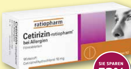
Cetirizin-ratiopharm® bei Allergien 50 Filmtabletten statt € 17,35 1)