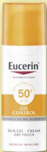
Eucerin® Sun Oil Control Gel-Creme 50+ 50 ml

Schon der Schriftsteller von Kotzebue fand: „Die Sonne ist die Universalarznei aus der Himmelsapotheke.“ Stimmt, doch wie für jede Medizin gilt auch dabei: Auf die richtige Anwendung kommt es an. Was Sonnenanbeter beachten müssen, erfahren Sie deshalb in Ihrer Guten Tag Apotheke und in der aktuellen Ausgabe unseres Gesundheitratgebers MEIN TAG. Freuen Sie sich also auf eine unbeschwerte Sommer-Sonnen-Zeit!